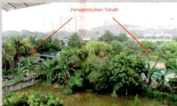
Lokasi pencerobohan di Tanah Perkuburan Islam Sungai Sekamat, Kajang.