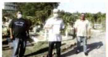
Ulu-Besah Ulu-Ampang, Persekitaran Perkuburan Islam Perkuburan Islam Sungai Selangor, Selangor pada hujung minggu.

Pemilik di Sungai Selangor, Selangor mendakwa ia cuba roboh sejak beberapa tahun lalu dan sudah bertanai hingga kini.