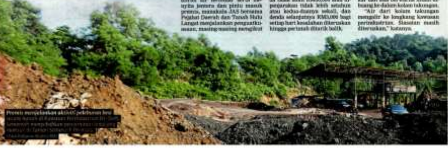
Premis menjalankan aktiviti peleburan besi secara haram di kawasan perindustrian Hutan di Sungai Semenyih