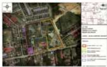
Peta Tanah Perkuburan Islam Sungai Selangor, Selangor.