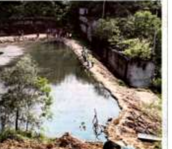
Petugas JAS memantau pembuangan air

"Penaik premis boleh dibayar pada kadar RM30,000 atau dipertanggungjawabkan oleh premis, manakala JAS dan MPK bersedia untuk membayar RM30,000 bagi setiap hari masalah dibenarkan hingga penat di tarik balik."