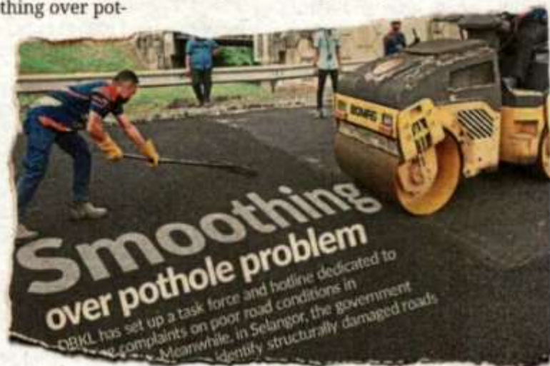
StarMetro's report on Feb 8.

"I know just how much damage tipper lorries and tractors can do to a road," he said, adding that DBKL must make public safety its utmost priority.