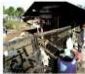
Pemilik di Sungai Selangor mendakwa ia cuba roboh sejak beberapa tahun lalu dan sudah bertanai hingga kini.

Tanah perkuburan Islam di Sungai Selangor di sini dikatakan akan menjadi tempat ternak dan bertani. Tanah perkuburan Islam di Sungai Selangor di sini dikatakan akan menjadi tempat ternak dan bertani. Tanah perkuburan Islam di Sungai Selangor di sini dikatakan akan menjadi tempat ternak dan bertani.