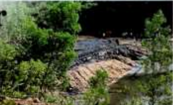
Longkang tercemar pembuangan sisa berwarna hitam di Taman Semenyih Permatas, Hulu Semenyih