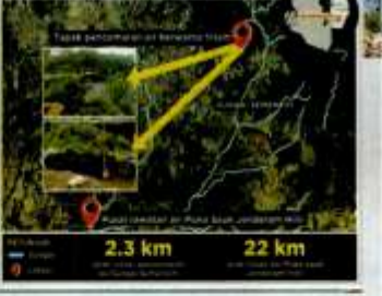
2.3 km 22 km

Ahli Kuala Alam Sebeling 1974 dan Kanan Tanah Negara 1965.